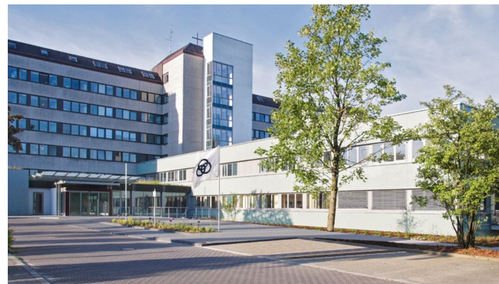
ALFRIED KRUPP KRANKENHAUS IN ESSEN-STEELE: Dort besteht die Klinik für Urologie und urologische Onkologie bereits seit 1925 als eigenständige Abteilung. Inzwischen betreut sie mehr als 3.000 stationäre und circa 5.500 ambulante Patienten jährlich.

Leider neigen Blasen Tumore zum Wiederkommen (Rezidivierung). Um einem Krankheitsrückfall vorzubeugen, wird >