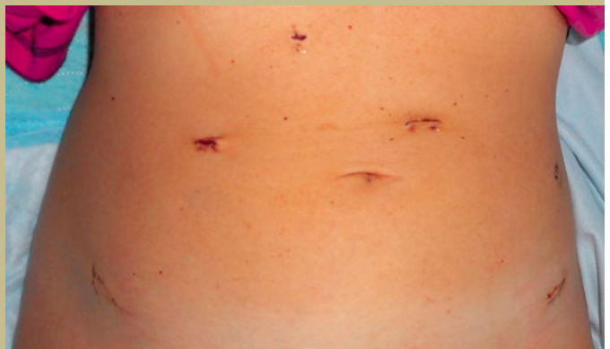
DEUTLICHER UNTERSCHIED: Im Gegensatz zur offenen Operationstechnik, die große Schnitte zur Eröffnung der Bauchhöhle erfordert, ermöglicht die spezielle Schlüssellochtechnik (roboterassistierte Laparoskopie) das Operieren ohne große Hautschnitte (minimalinvasiv).

► häufig eine örtliche Behandlung mittels Blasenspülung mit Medikamenten wie Mitomycin C, Doxorubicin oder Bacillus Calmette-Guérin (BCG) empfohlen.