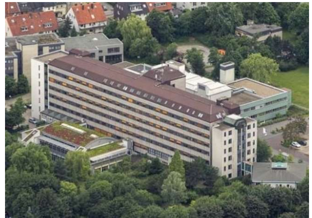
Alfried Krupp Krankenhaus, Essen-Steele

Woran erkenne ich, dass ich herzkrank bin?