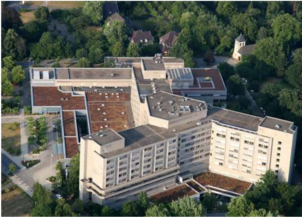
Alfried Krupp Krankenhaus, Essen-Rüttenscheid